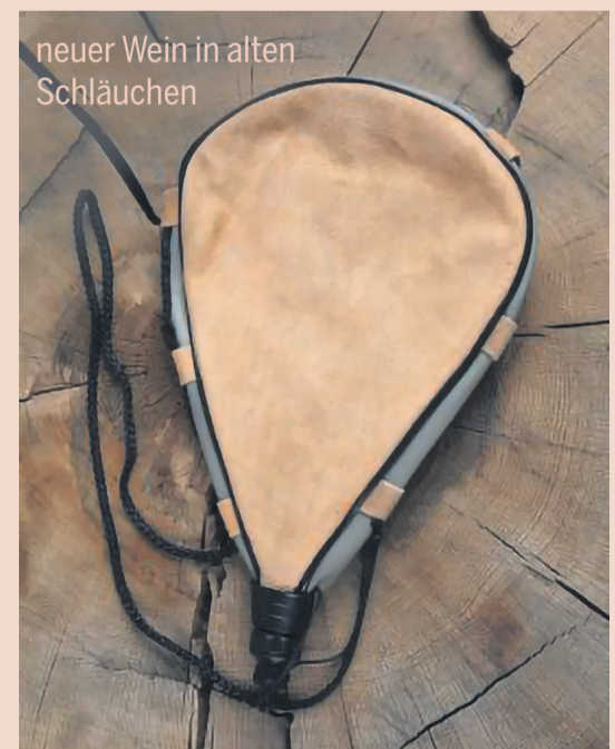
neuer Wein in alten Schläuchen

19. Oktober 2025, 10.00 Uhr, Markuskirche Bettlach