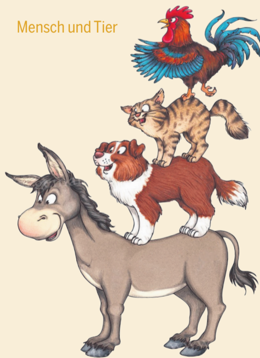
Mensch und Tier

12. Oktober 2025, 10.00 Uhr, Zwinglikirche Grenchen