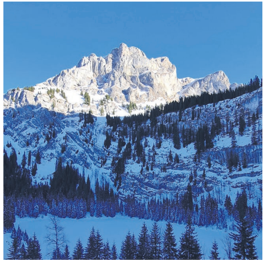
Oltschiburg Axalp ob Brienz

zustreuen, sondern achtsam. Das Unfertige stehen lassen zu können, ohne sofortige Lösungen erzwingen zu müssen. Raum zu lassen für das, was Gott in uns wachsen lassen will. Langsamkeit ist kein Rückzug aus der Welt, sondern eine Form geistlicher Aufmerksamkeit: Wir öffnen die Augen für das, was schon da ist und was sich zaghaft zeigt. In einer Welt, die ungeduldig nach schnellen Antworten ruft, dürfen wir eine andere Haltung einnehmen: die des Zuhörens, des Vertrauens, des geduldigen Hoffens. Diese Haltung ist nicht weltfremd – sie ist Ausdruck eines Glaubens, der weiss, dass Gottes Wirken oft im Verborgenen beginnt. Wie ein Same, der im Winter unter der Erde ruht, bevor er im Frühling sichtbar wird. Und vielleicht entdecken wir gerade in dieser Haltung ein neues Miteinander. Ein Mit-einander-Gehen, das nicht verlangt, dass wir gleich denken oder fühlen, sondern dass wir einander mit Gottes Augen sehen. Als Menschen, die auf Barmherzigkeit angewiesen sind – und sie zugleich